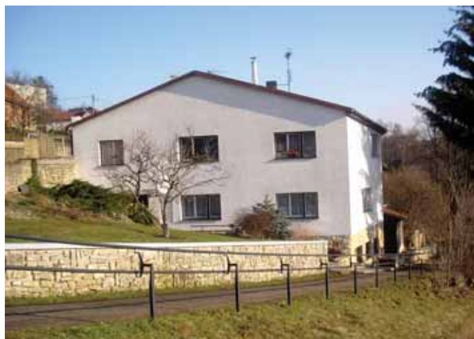
Po přestavbě v r. 1995