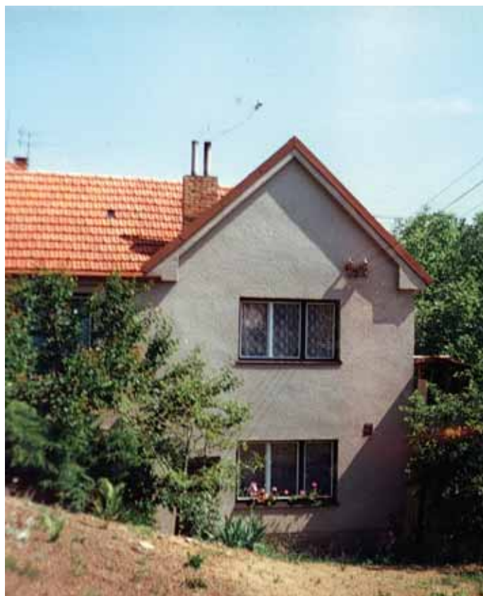
Po přestavbě na rodinný domek v r. 1977