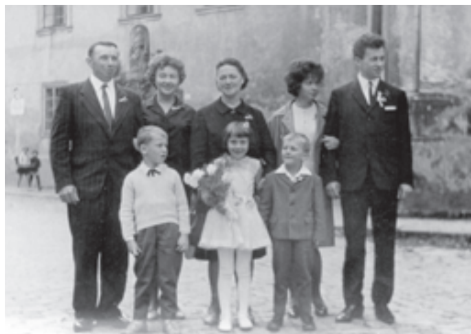
Svatošova rodina v roce 1967