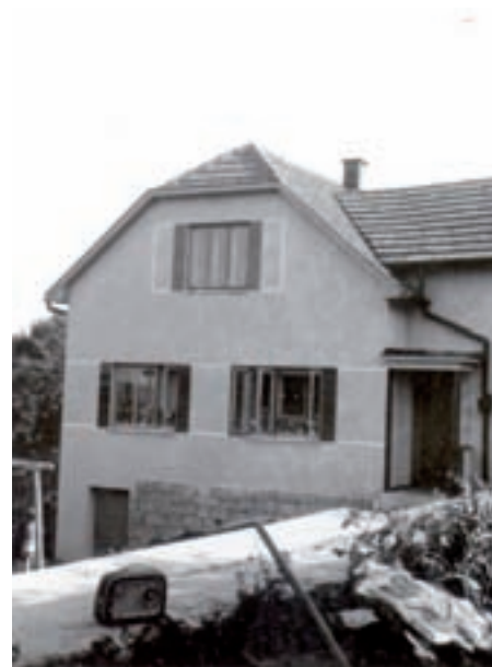
Po přestavbě v r. 1957