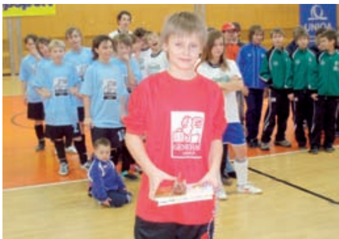
HALOVÝ TURNAJ LITOMYŠL