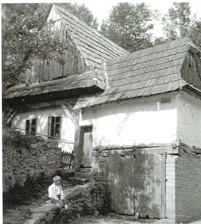
Vomočilova chalupa v Malvařicích č. 69 ve 30. letech 20. století od západu