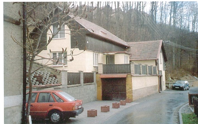
Rekreační chalupa č. 69 současný stav