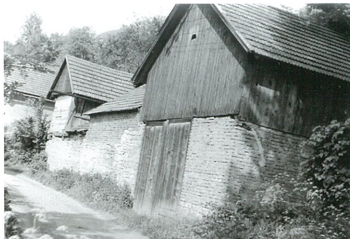
Chalupa č. 69 pohled z jihu v 40. letech