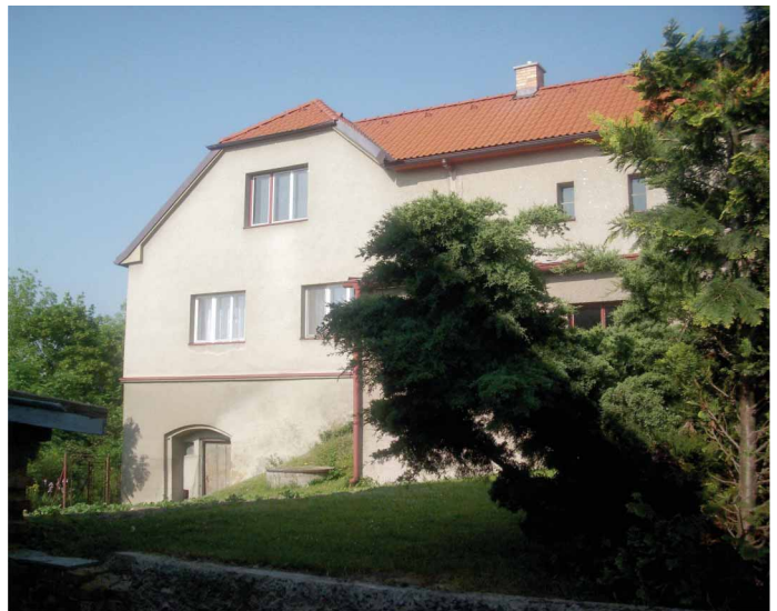
Pohled od východu