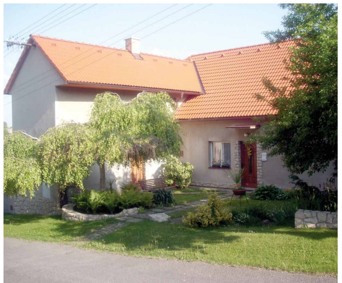
Pohled od západu