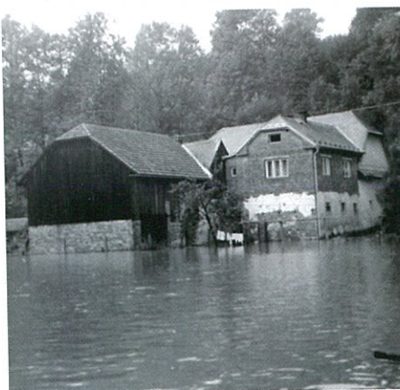
Povodeň 29. srpna 1970