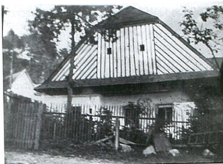
Chalupa č. 70 po I. svět. válce