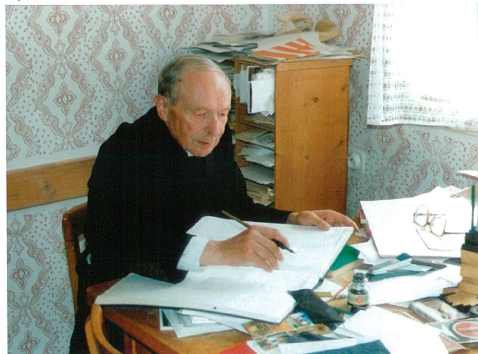
Ve své pracovně na faře v roce 1992

Jako národ jsme otráveni materializmem. Náš národ byl v úpadku ve srovnání s evropskou úrovní - jazykově, literárně a umělecky, ale vzchopil se. Tehdy všude napomáhali kněží, kteří ovlivňovali učitelstvo. Existovala úcta ke křesťanským hodnotám, jak se o tom píše třeba v románu "Zapadlí vlastenci". Konaly se národní poutě ke svatému Janu Nepomuckému do Prahy. Vlastenci dávali hlavy dohromady. Sbíral se haléř k haléři. Bylo postaveno Museum Království českého, Stavovské divadlo, Prozatímní divadlo a nakonec i Národní divadlo. Jestliže český národ nemá zmizet z mapy světa, je nutné získat široké vrstvy obyvatelstva pro konkrétně žité evangelium Ježíše Krista. Žádné jiné náhražky nám nepomohou.