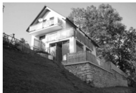
Nový rodinný domek č.p. 614