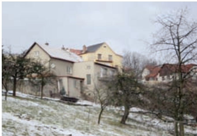
Současný stav RD pohled JZ