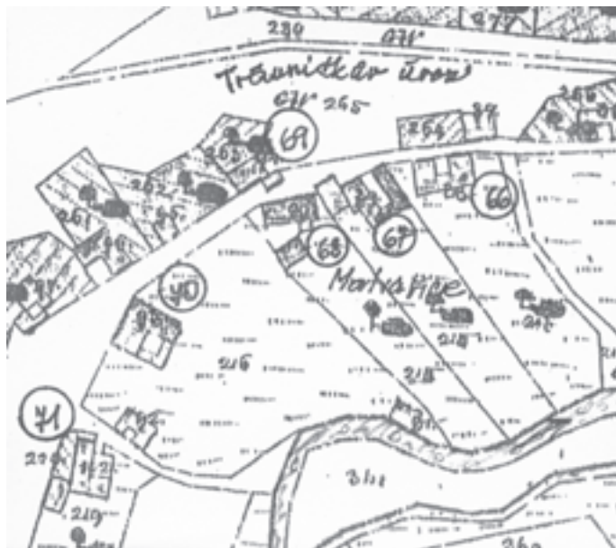
Výřez z mapy stabilního katastru 1839