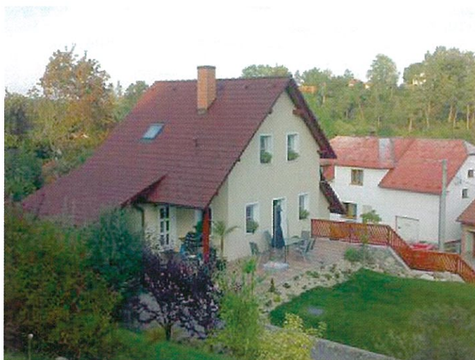
Současný stav pod novým číslem 668