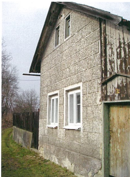
Původní stav od jihu