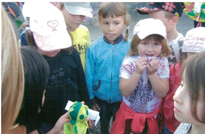
Dráček Fráček předčítá dětem zadaný úkol...vyluští takovou záladnou otázku?