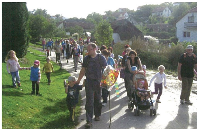
Hurá...jdeme cesta necesta...najdeme tu další úkol?