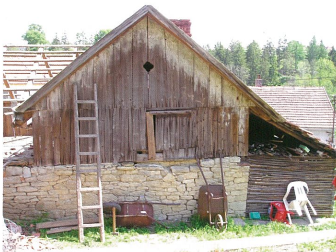
Původní stav od západu