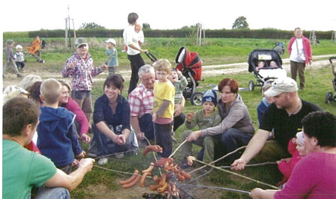
Dráčci se proletěli, my jsme se vydováděli...a už nám kručí v žaludku. Opékáme buřtíky... a pak jsme je všechny snědli ... mňam!