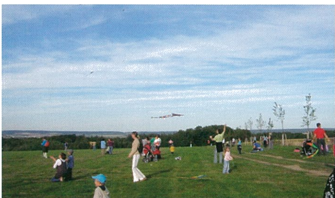
Chystáme své draky...poletí? Letííí!