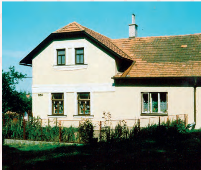
č. p. 264 v r. 1985