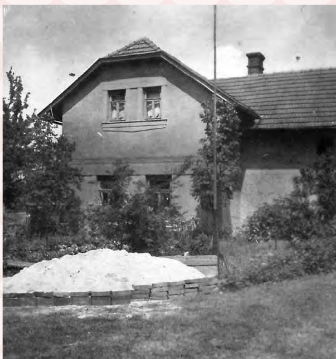
č.p. 264 v r. 1954, přestavba v r. 1960