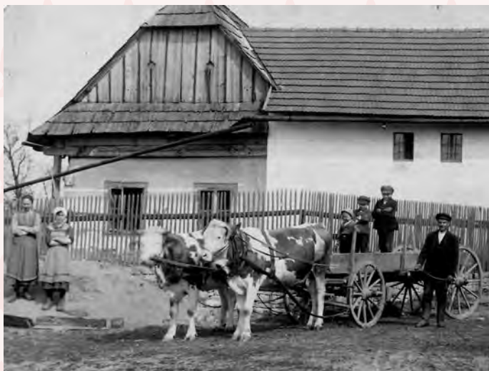
č.p. 264 v r. 1924, přestavba v r. 1928