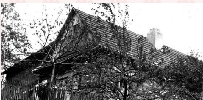
původní rodná chalupa na Pazušě č. 249