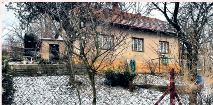
č. p. 249 současný stav