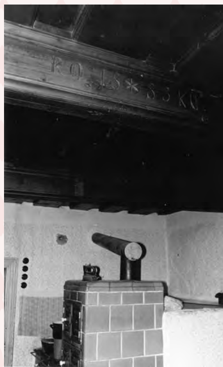
světnice v č.p. 260 v r. 1980