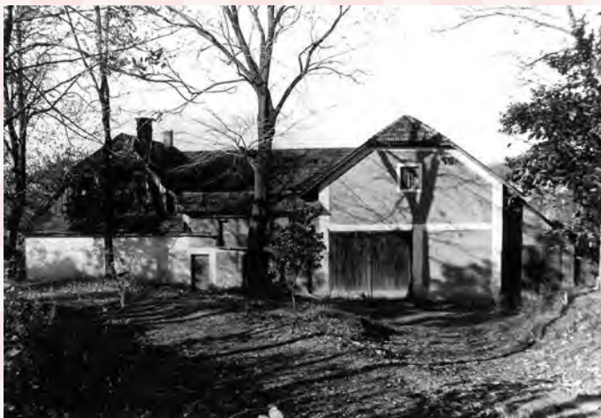
č. p. 260 v r. 1980