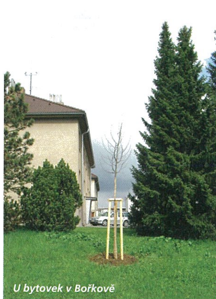
U bytovek v Bořkově