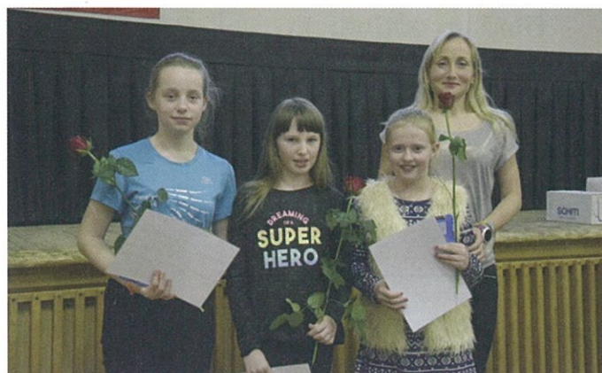
Volejbalistky Ml. žákyňe