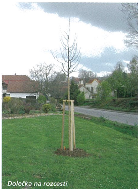
Dolečka na rozcestí