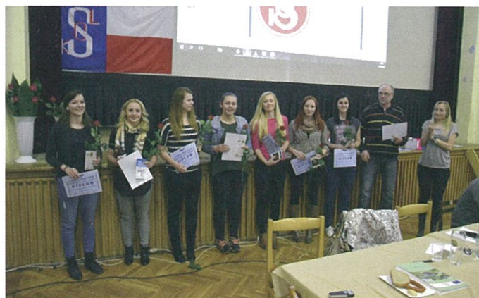
Historicky I. místo, Krajský přebor Ženy „A“