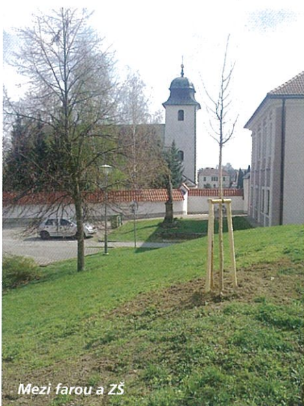
Mezi farou a ZŠ