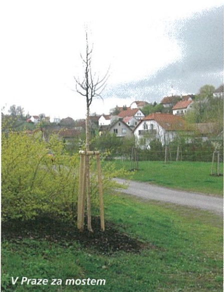
V Praze za mostem