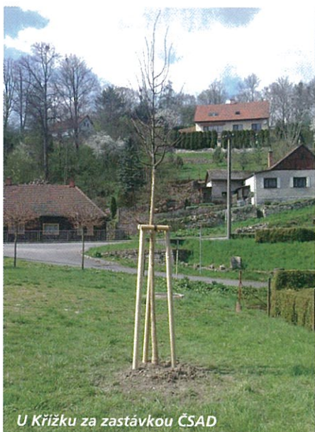
U Křížku za zastávkou ČSAD

Nemá být člověk jako strom? Vyrůstat, košatět, krásnět a pak dát všem kolem stín, svěžest, radost, plody..?