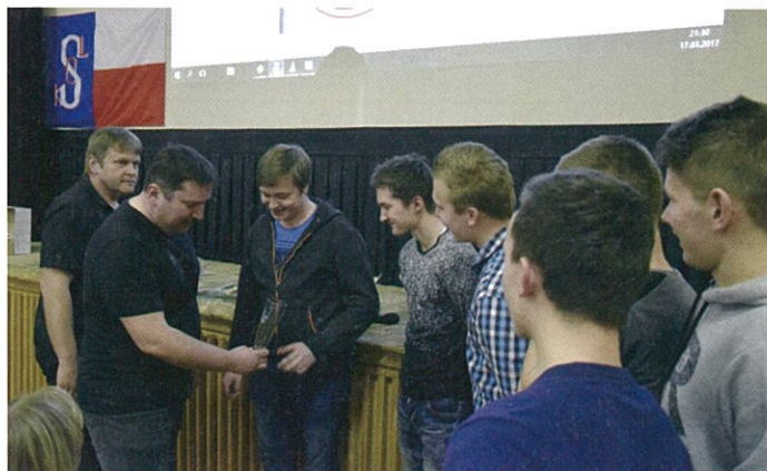
I. místo, Krajský přebor Dorost