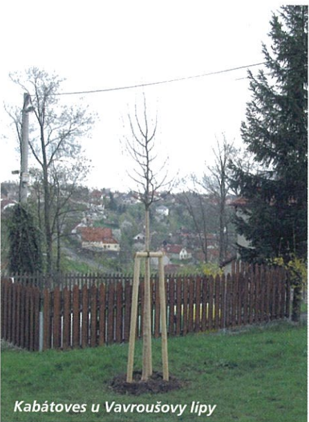
Kabátoves u Vavroušovy lípy