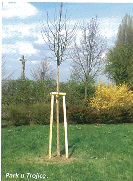
Park u Trojice