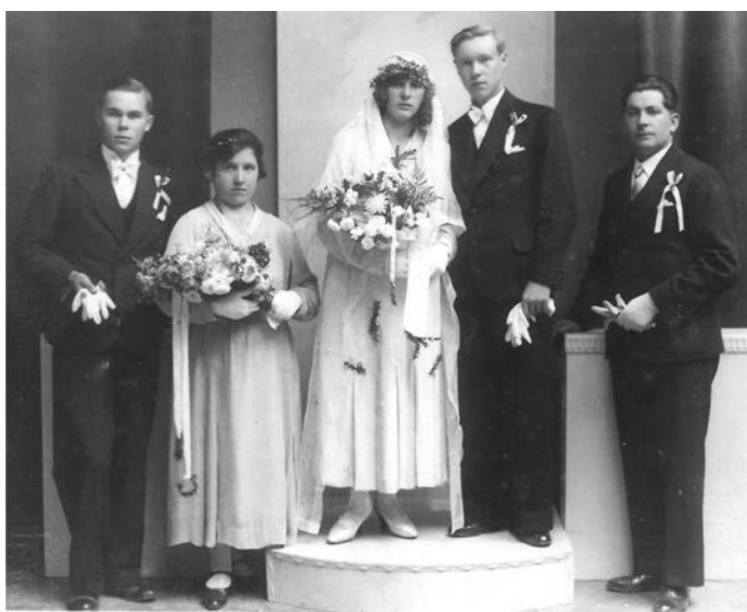
svatební foto z r. 1932