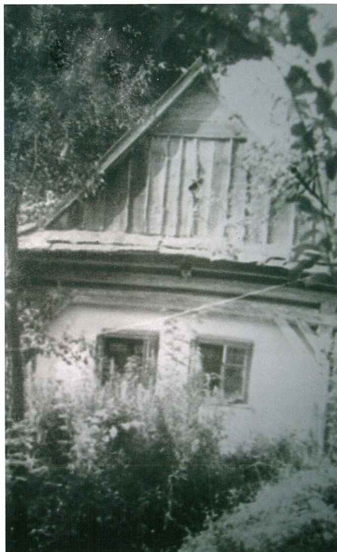
Původní chalupa čp. 175