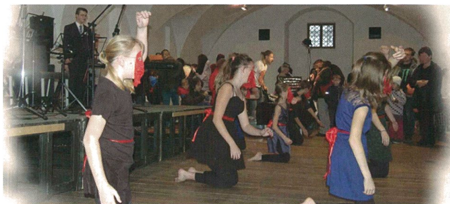
Taneční obor - Den medu