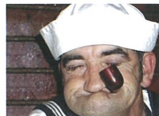
Váš Pepek Námořník

Zvolte mě jako prezidenta „Dolnoújezdského masopustu“ a učíte, jak špenátová energetická bomba proudí do vašeho těla a vytváří svalovou hmotu. Mám selský (možná trochu zelený) mozek a budu pro Vás pracovat do roztrhání těla. Nechci být ani předseda vlády ani ministr financí, „Chci být Váš masopustní prezident – DEJTE MI SVŮJ HLAS“.