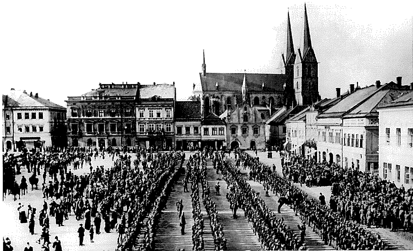
Vysoké Mýto: 98. pluk před odchodem na frontu

Pěšky se šlo do Chocně a odtud vlakem na Halič. Z místa vykládky se šlo pěšky i několik dní na místo určení. Při těchto pochodech se začaly projevovat nedostatky rakouské armády. Vojáci nedostávali i několik dní pravidelnou stravu, žili ze svých zásob z domova nebo byli nuceni si jídlo kupovat od civilního obyvatelstva. A příchodem tak značného