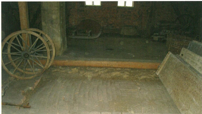
Půda před rekonstrukcí