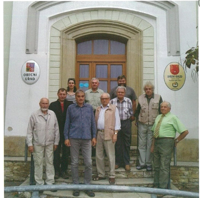
Část členů Klubu