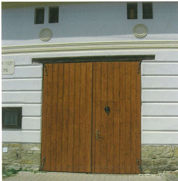
Nová přední vrata