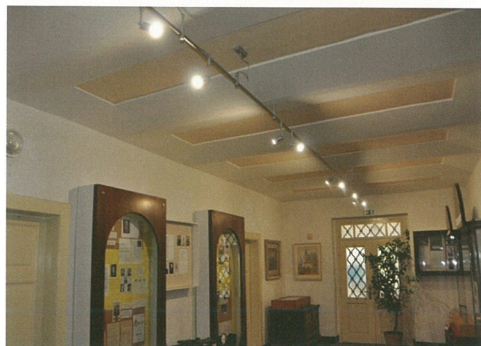
Nové osvětlení vestibulu