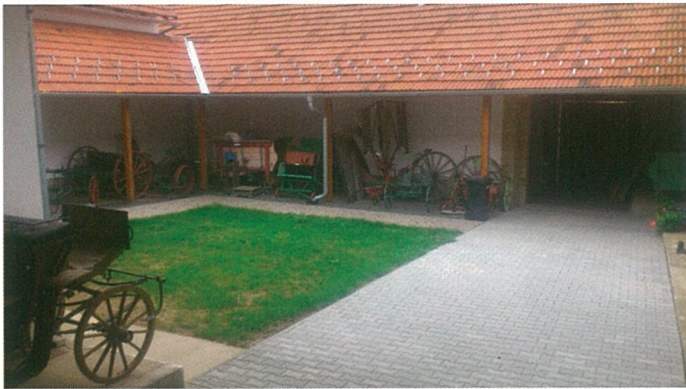
Dvůr po rekonstrukci