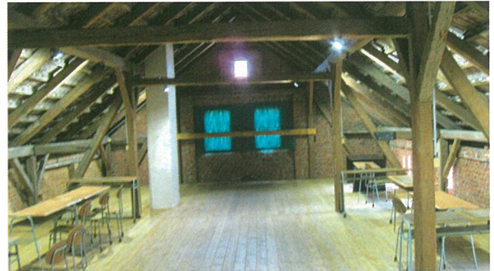
Půda po rekonstrukci