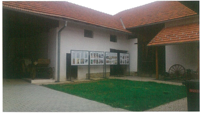
Dvůr po rekonstrukci