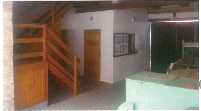
Nová pokladna a schody