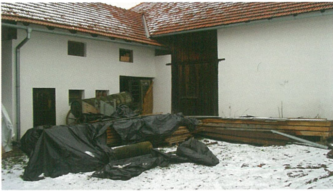
Dvůr před rekonstrukcí