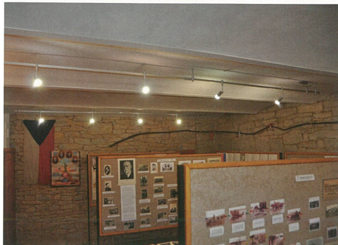
Nová výstavní místnost