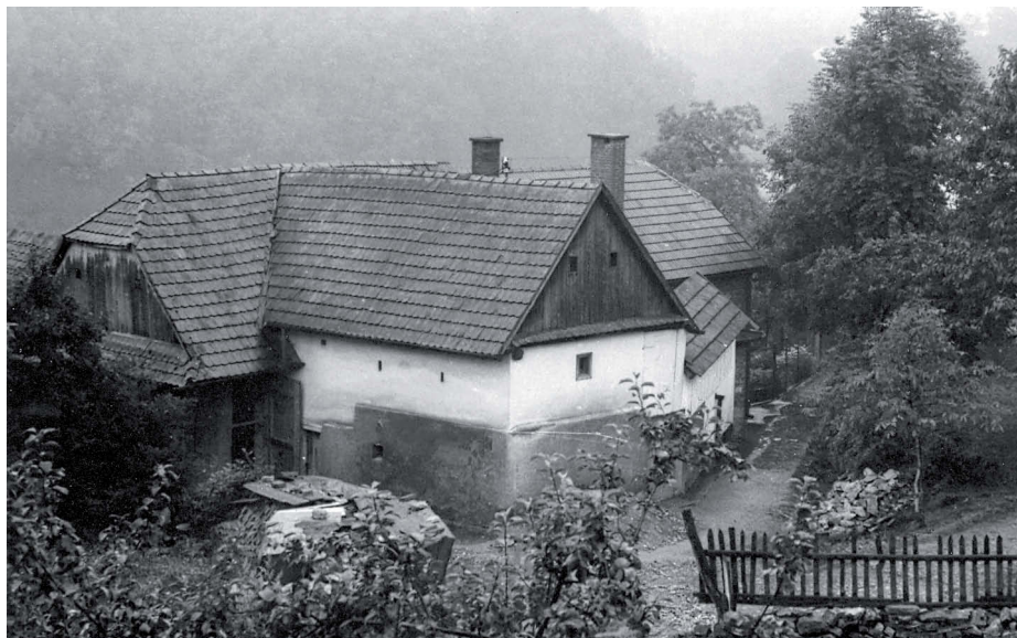
Pohled od západu.