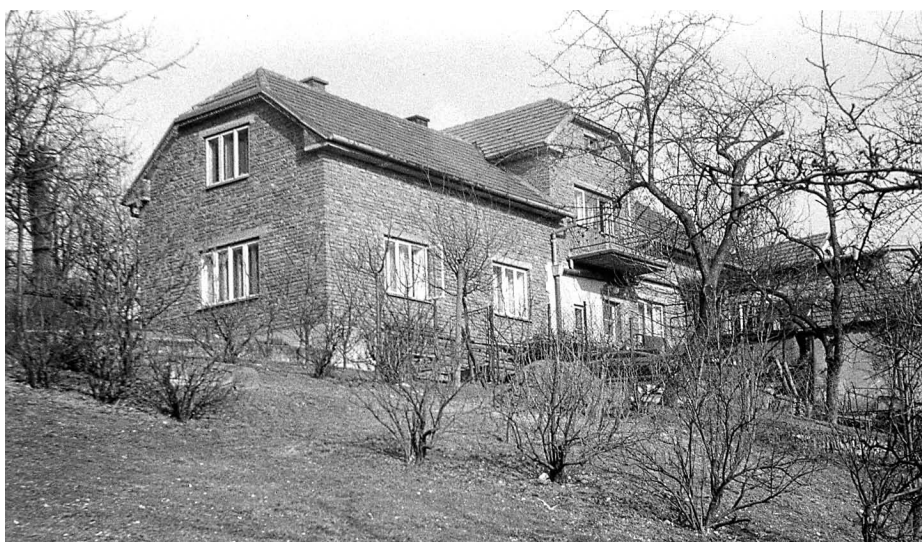
Pohled od východu, po přestavbě v 60. letech