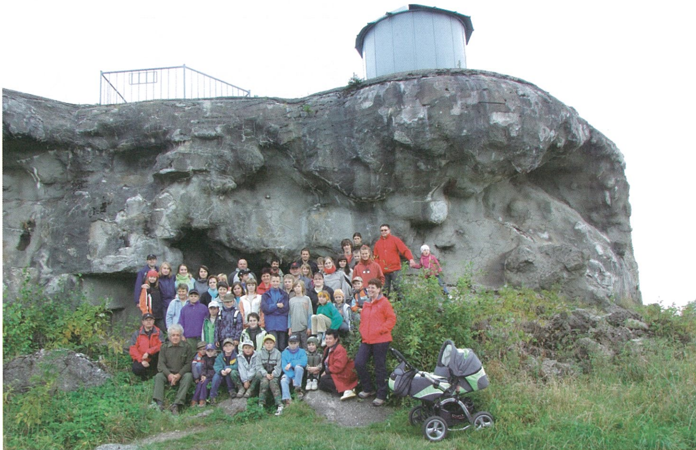
Společné foto před pěchotním srubem N-S 72 „Můstek“

Plni zážitků a možná i nových přátelství, hlavně ale spokojeni z pěkně prožitého dne, jsme se vrátili domů.