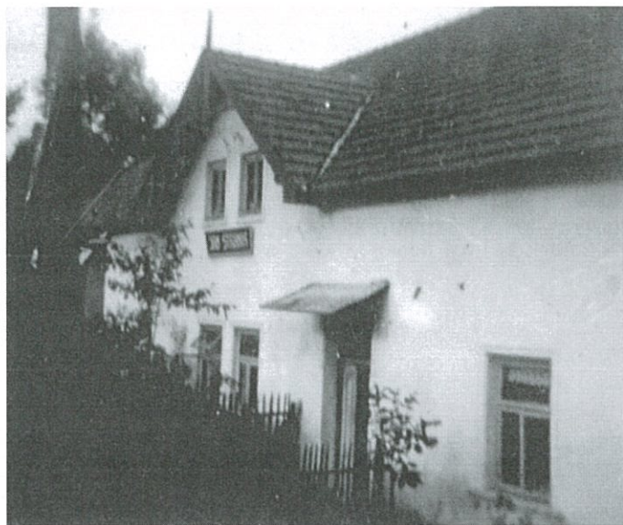
U Stráníků, ve 40. letech 20. století