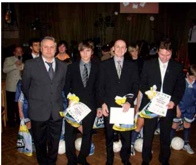
Fotbal - muži B