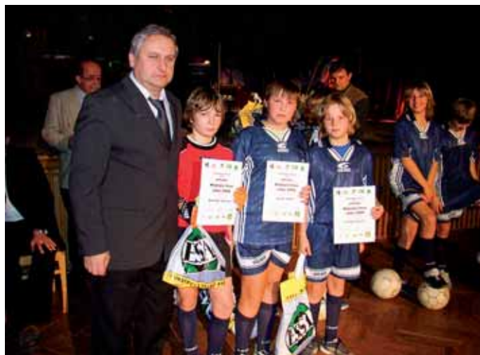
Fotbal - mladší žáci se starostou p. Bšem