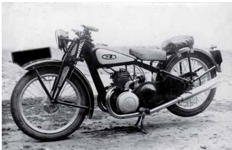
Motocykl z roku 1937