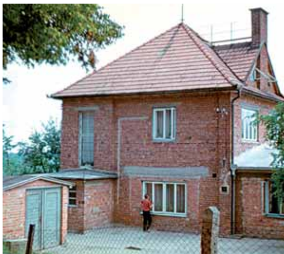
Před rokem 1971