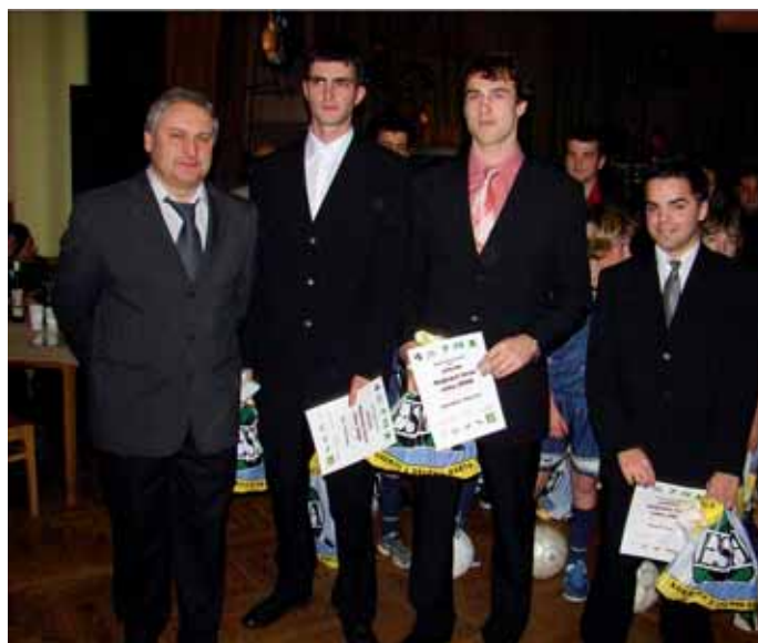
Fotbal - muži A