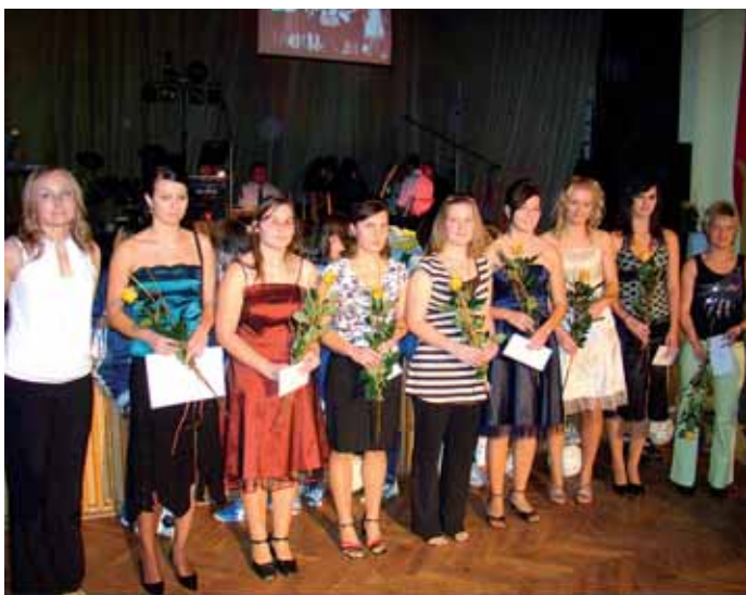
Volejbal - juniorky - I. liga