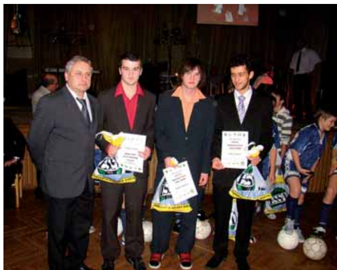
Fotbal - dorostenci