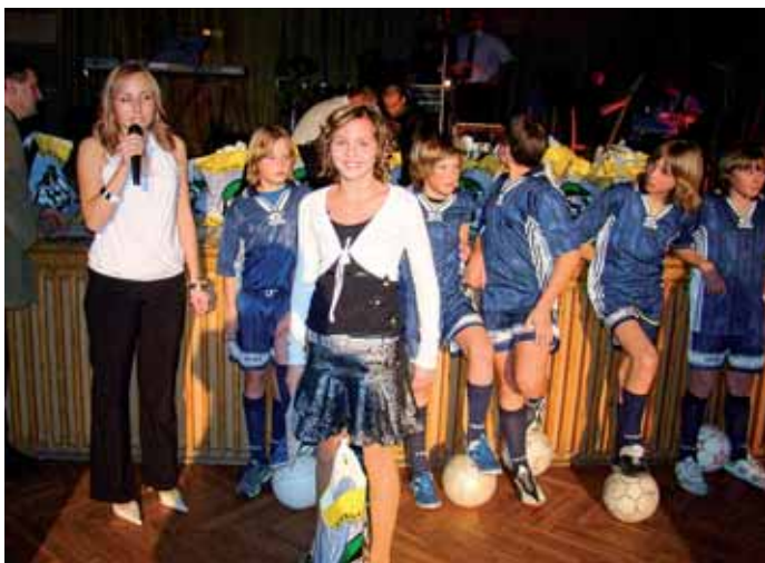
Volejbal - žákyně

Ples tradičně zahájili nejmenší sportovci SOKOL Dolní Újezd, byli vyhlášeni nejlepší sportovci SOKOL Dolní Újezd, stará garda tradičně nacvičila půlnoční překvapení.