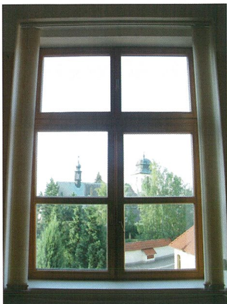
Výměna oken v ZŠ