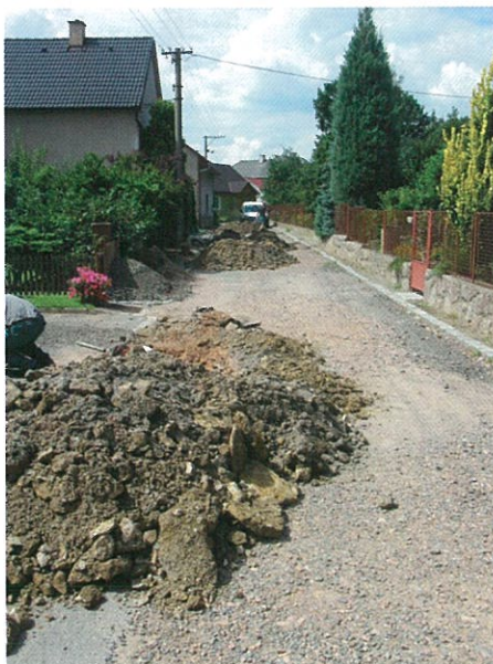
Asfaltování komunikací (před)