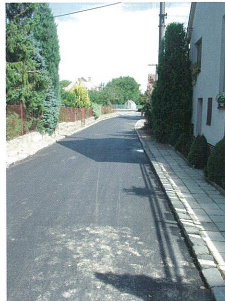
Asfaltování komunikací (po)