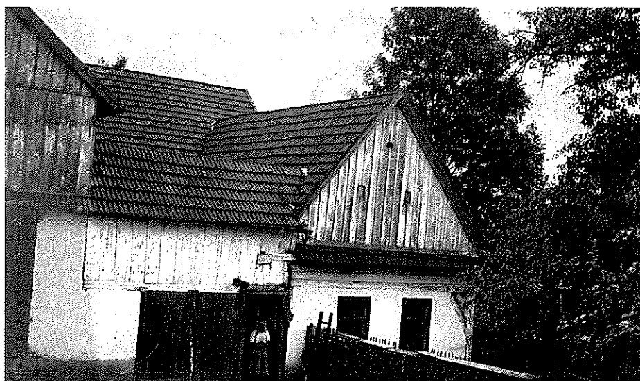
Chalupa č. 75, před přestavbou v r. 1934