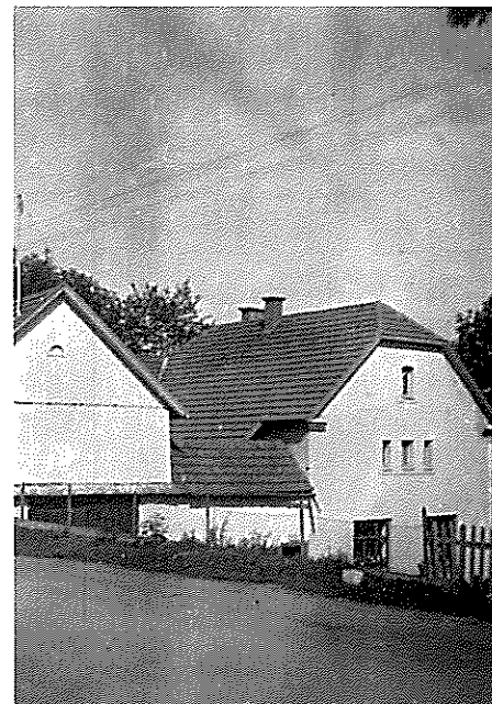
Nové stavení č. 75. Foto z 40. let